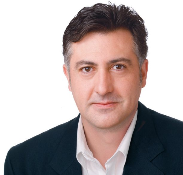
Joan Puigcercós, president d'Esquerra

Les consultes populars que a nivell municipal s'estan organitzant arreu del país han de comptar amb la nostra presència i participació més actives. La nostra aportació ha de ser treballar per aconseguir una àmplia participació que legitimi aquest exercici democràtic que se celebrarà a centenars de localitats. I si bé el sentit del nostre vot no pot ser altre que un Sí rotund, cívic, serè i alhora entusiasta, també ens cal posar de manifest que l'exercici del dret a decidir és l'expressió natural i exemplar d'aquelles societats veritablement democràtiques.