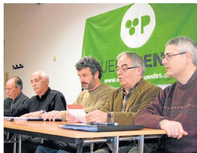
Membres de la permanent de la Plataforma aquest dimarts | 308