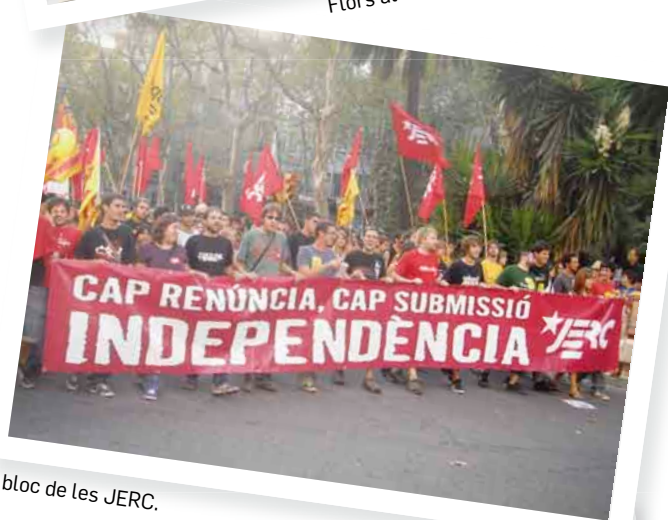
El bloc de les JERC.