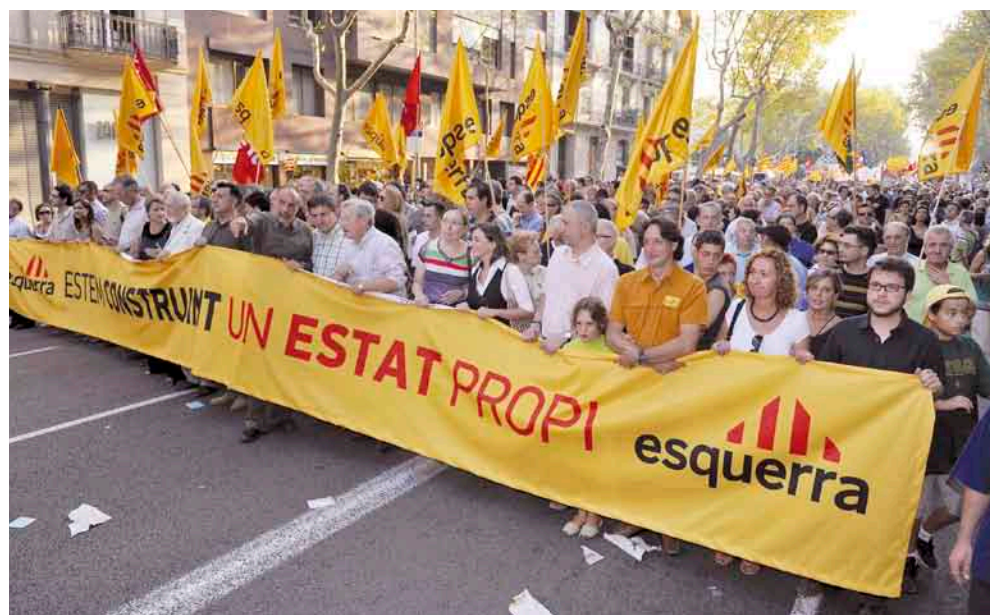
Capçalera del bloc d'Esquerra a la manifestació de l'Onze de Setembre.