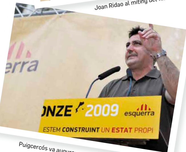
Puigercós va augurar que la independència és més a prop.