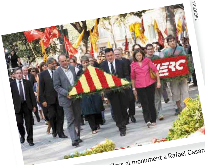
Flors al monument a Rafael Casanova.