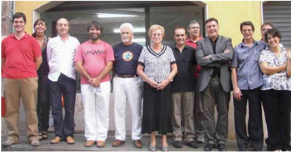
Puigcercós i la secció local de Sant Quintí de Mediona davant el Casal d'Esquerra d'aquesta vila del Penedès.