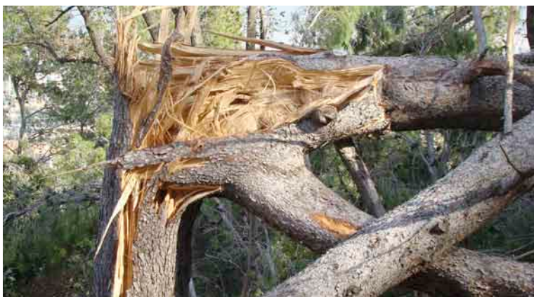
Els efectes del vent van ser devastadors. Fotografia del camí Aneto.