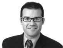
SERGI DE LOS RIOS és diputat al Parlament de Catalunya