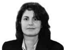
GEMMA PUIG és directora general de Comerç de la Generalitat de Catalunya