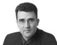
LLUÍS SALVADÓ és delegat de la Generalitat a les Terres de l'Ebre