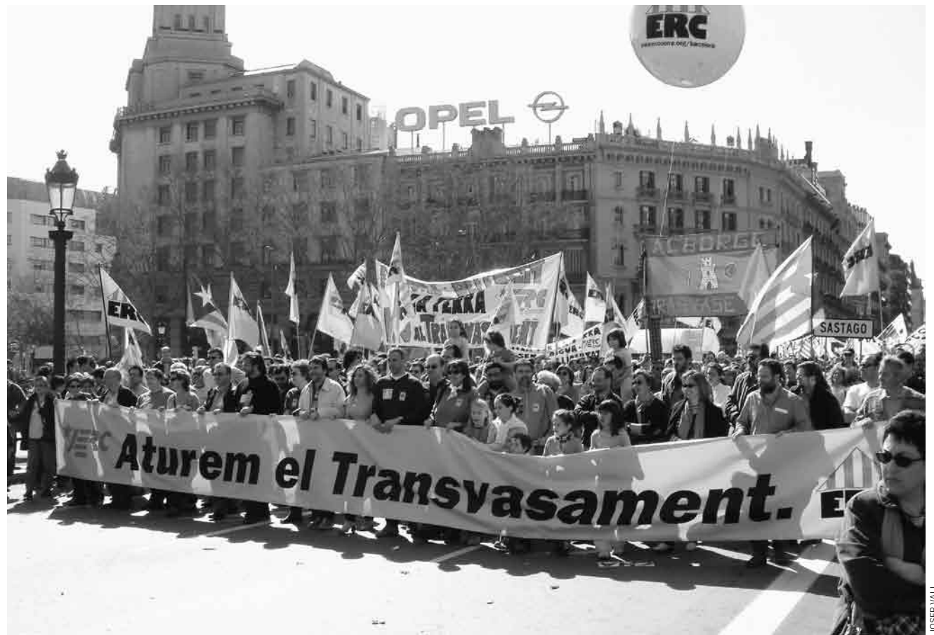
Capçalera d'Esquerra a la manifestació del 10 de març de 2002 a Barcelona en contra del PHN.

Aquest model de dependència del territori, administrat per uns quants, és el principal escull amb