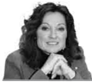
MARTA CID és diputada al Parlament de Catalunya

Les Terres de l'Ebre, territori cruïlla dels Països Catalans, tenen un encaix geogràfic que li confereix unes potencialitats de comunicació i node econòmic indubtable. L'equidistància entre Tarragona i Castelló o entre Barcelona, València i Saragossa, fa d'aquest territori un punt estratègic del nostre país, de l'eix mediterrani i també de la connexió amb l'eix occidental i França. És possible que aquesta mateixa potencialitat (o el perill que suposa) hagi estat el seu major enemic.