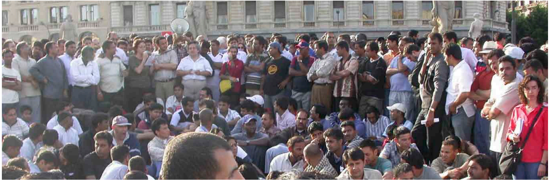
ACN / XAVIER VALLBONA