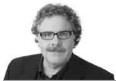
JOAN TARDÀ és diputat al Congrés

Pel que fa a com encarar el fet migratori, espanyols, tant la dreta com l'esquerra, i catalans ho veiem diferent. Cert que, com que les lleis del funcionament de l'economia capitalista constitueixen les parets mestres de totes les societats del primer món, les diferències són exclusivament de caràcter polític, però hi són.