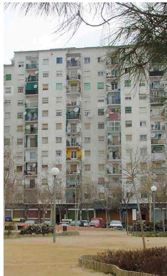
ACN / MARC RIERA

Habitatges de Can Garcia, a Manlleu. Un exemple de barri on hi viu un percentatge molt alt d'immigrants i on és important que els ajuntaments hi facin polítiques d'inclusió i cohesió.