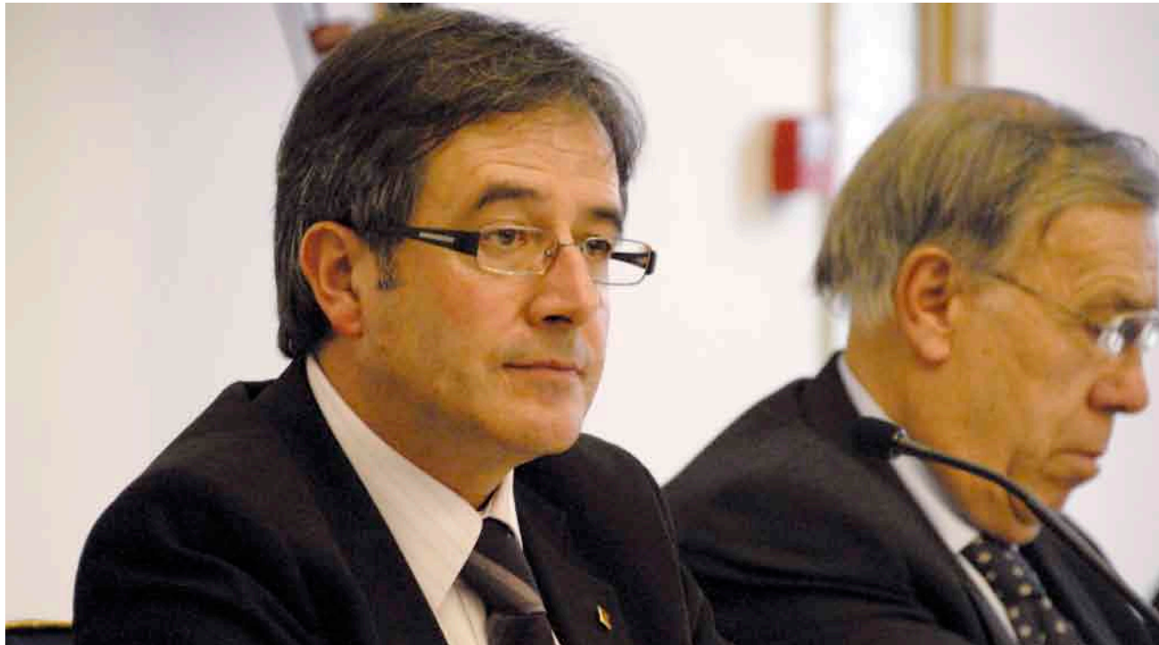
ACN / PERE FRANCÈCH