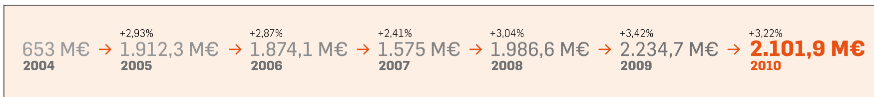
Dades d'inversió comarcalitzada dels Pressupostos de la Generalitat.

S'ha corregit el greuge sense perjudicar la resta del país