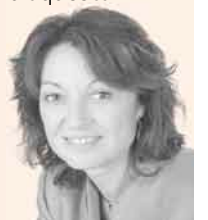
Marta Cid Diputada al Parlament de Catalunya

El Govern de Catalunya ha donat un pas històric, un pas sense retorn cap a la nova ordenació territorial de Catalunya. Tot i això, encara ens queda molt per constituir la vegueria de l'Ebre, un llarg trajecte que comptarà amb el lideratge i el treball d'Esquerra fins al darrer dia d'aquesta legislatura.