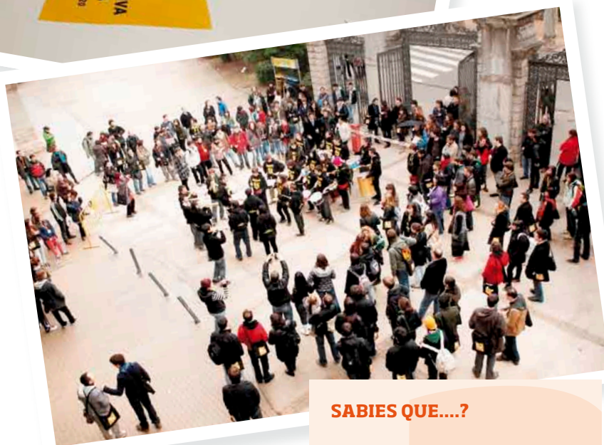
La Trobada del Pla Nacional de Joventut de Catalunya, a Manresa.