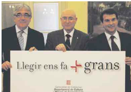
El conseller Tresserras amb els presidents del RCD Espanyol i del FC Barcelona.