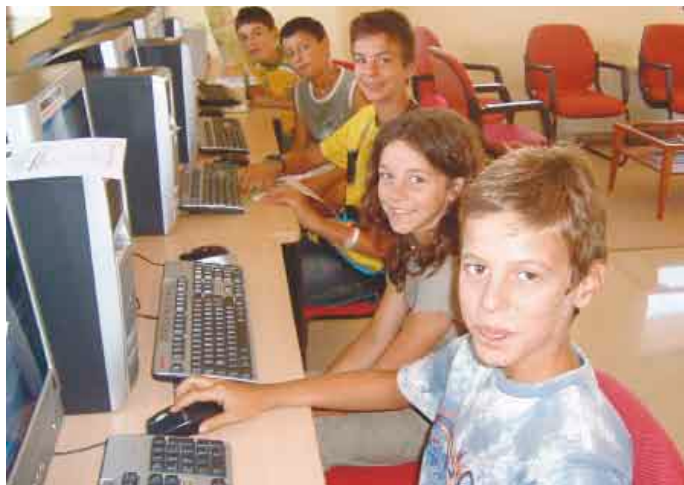
AJUNTAMENT DE SANT PERE PESCADOR