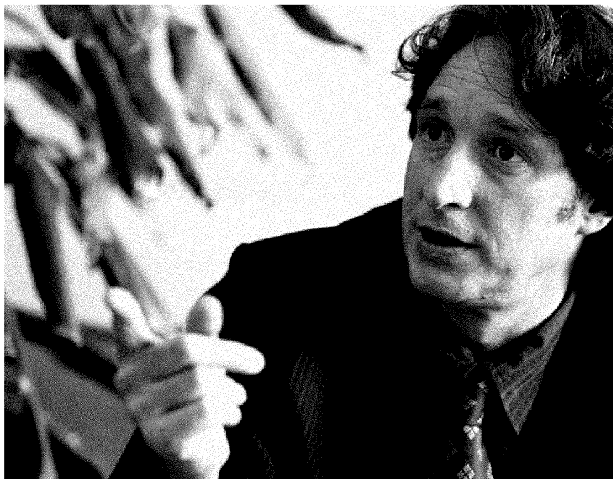
El cap dels republicans, durant l'entrevista.

—«Bé... De mica en mica s'ha anat aclarint una determinada lectura del ROM [reglament orgànic municipal]. I això ve de l'actitud. Perquè primer el govern volia fer una lectura que els permetia governar en minoria, i poc a poc