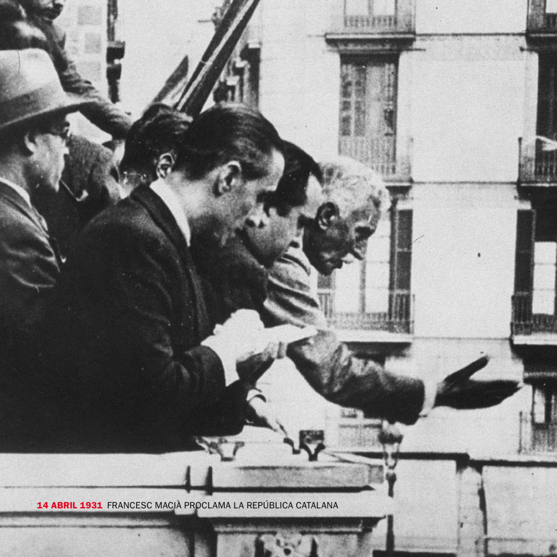
14 ABRIL 1931 FRANCESC MACIÀ PROCLAMA LA REPÚBLICA CATALANA