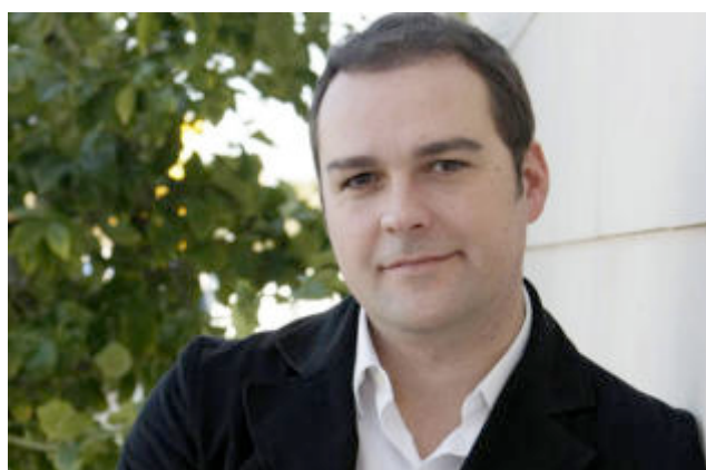
"Calvo es tan responsable de Cerdó como Cirer de Rodrigo de Santos"

–¿Insinúa que Cañellas era nacionalista?