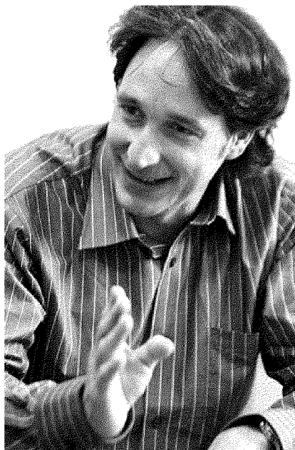
El virtual candidat d'ERC, durant l'entrevista.

—Però des del moment que hi ha possibilitat d'un canvi polític a