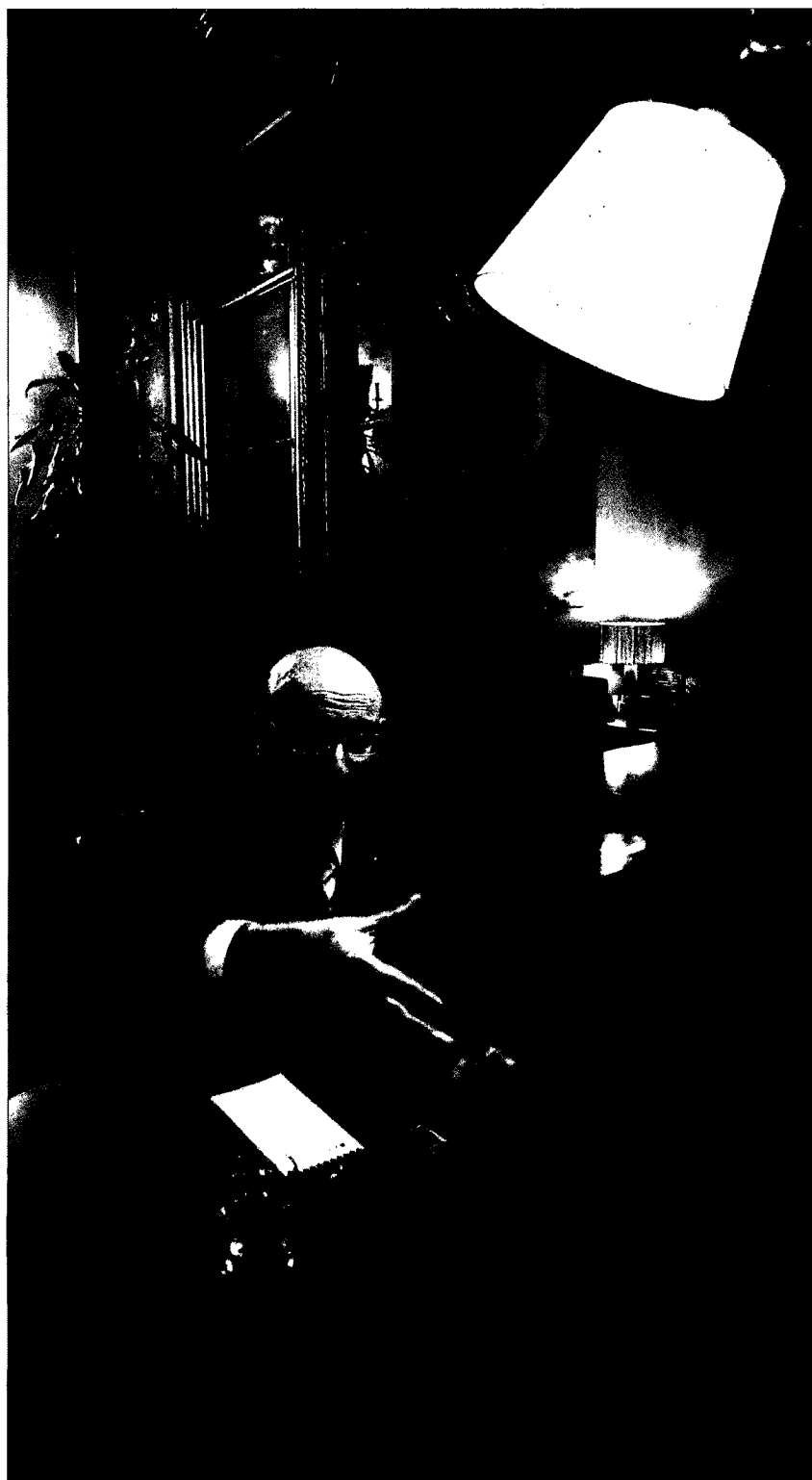
El conseller atribueix la situació actual a la no acceptació del plurilingüisme de l'Estat durant la Transició ■ C. CALDERER

això comporta responsabilitats legals i comporta renunciar a un mercat que representaria al voltant del 0,8% o l'1% del mercat mundial. Una cosa és quan la gent a la taula de negociació hi posa els soldats de plom, l'artilleria i l'aviació, i l'altra és el debat sobre uns interessos que nosaltres tenim voluntat de conciliar. No ens ho plantejem com un pols.