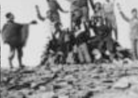
Miting electoral d'ERC celebrat a Barcelona en vigílies de les eleccions legislatives 12 de gener de 1936