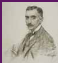
1906 Retrat de Francesc Macià, realitzat per Ramon Casas