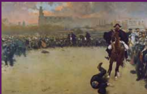
1902 Aquest quadre de Ramon Casas és conegut tant com La càrrega com a Barcelona 1902 . Casas, sensible a la realitat social i política recollí en aquesta tela magistral el moment culminant de l'enfrontament de la massa de manifestants amb les forces repressores de l'Estat de la gran vaga de 1902.