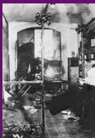
Barcelona, 26 novembre 1905 La redacció del Cu-cut! després de l'assalt.

El govern suspèn les garanties constitucionals a la província de Barcelona i les Corts aproven la Llei de Jurisdiccions —amb els únics vots en contra de regionalistes i republicans— per la qual tota ofensa de paraula o escrit a l'exèrcit, la pàtria o els símbols espanyols ha de jutjar-se en consell de guerra. La Llei, que sotmet la sobirania del poder civil al militar, consagra l'intervencionisme de l'exèrcit en la vida política, plantant una llavor de conseqüències dramàtiques.