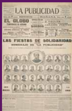
20 maig 1906 La Publicidad s'afegí a l'homenatge als diputats i senadors de Solidaritat Catalana que combateren la Llei de Jurisdiccions.