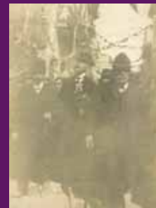
Les Borges Blanques, circa 1916 Pintura de Francesc Macià, al carrer del Carme, amb motiu de l'aplec de la Serreta. MGT