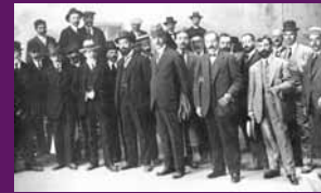
Novembre 1907 El diputat Francesc Macià visitant les zones del Noguera Pallaresa afectades per uns recents aiguats. F22019 Macià