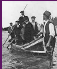
circa 1907 El diputat Francesc Macià amb altres prohoms ajudant a fer campanya a favor del ferrocarril de la Noguera Pallaresa. F22019 Macià