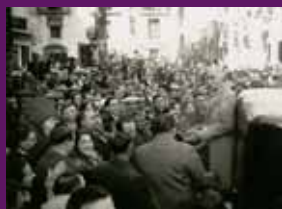
Esparreguera, 6 desembre 1931 La popularitat de Macià atreia la gent all on anés.