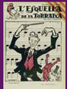
7 agost 1931 Portada de L'Esquella de la Torratxa.