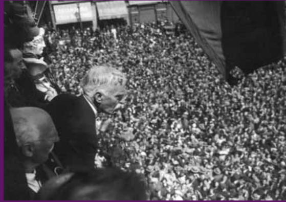
Barcelona, 24 abril 1931 Durant els primers dies l'alegria desbordà els carrers de Barcelona, Macià es dirigeix al poble des del balcó del Palau de la Generalitat

El novembre de 1932 tenen lloc les primeres eleccions de la història al Parlament de Catalunya. Esquerra, coaligada amb la Unió Socialista de Catalunya, les guanya amb majoria absoluta. El 6 de desembre Francesc Macià és investit president de la Generalitat.