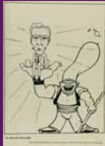
3 juliol 1931 L'Esquella de la Torratxa resalta la devoció popular cap a Macià.