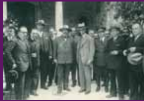
Barcelona, 1 maig 1931 Visita d'Emili Vandervelde, president de la Internacional Obrera i Socialista, al Palau de la Generalitat.