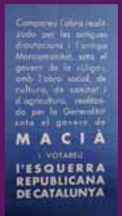
1933 Cartell electoral d'Esquerra CCPE