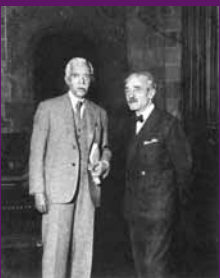
Barcelona, 9 maig 1933 L'escrutor Francesc Pi i Suñer visita Francesc Macià al Palau de la Generalitat.