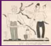
13 novembre 1932 Acudit de La Campana de Gràcia, durant la campanya electoral al Parlament de Catalunya. Argenteo / ANC-Democràcia