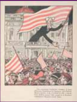
19 novembre 1932 Il·lustració de La Campana de Gràcia en suport d'Esquerra i Macià a les eleccions al Parlament de Catalunya. Josep Robert / ANC-Democràcia