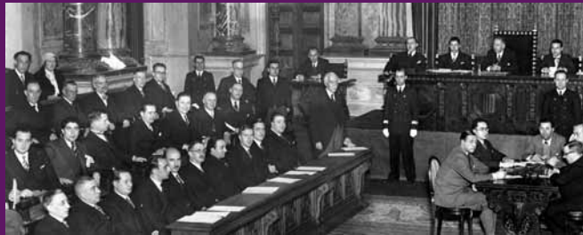
Barcelona, 6 desembre 1932 Investidura de Francesc Macià com a president de la Generalitat en un Parlament presidit per Lluís Companys.