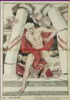
25 novembre 1932 La victòria d'Esquerra i Macià a les eleccions al Parlament de Catalunya vista per L'Esquella de la Torrada, significa la fi del bipartidisme entre la Lliga Regionalista i el Partido Republicano Radical de Lerroux que havia dominat la política catalana durant les primeres dècades del segle XX. Ricard Orosco / FC