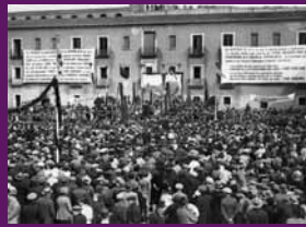
Barcelona, 6 març 1932 Acte d'inauguració de les obres del centre escolar Col·legi i Gil.