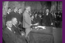
Barcelona, 30 octubre 1932 Francesc Macià signa una llei de pensions a un home dins de l'acte de celebració de la IV Festa Mutualista i III Tribut d'Homenatge a la Veïneria Mutualista, al Teatre Novedades.