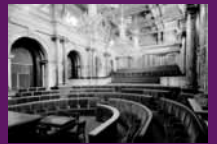
Barcelona, 1933 Ordre d'atribució del Parlament de Catalunya.