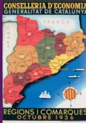
1936 Mapa de Catalunya, en 9 regions i 38 comarques. La divisió territorial de Catalunya fou confeccionada per Pau Vila l'abril del 1935, i va ser aplicada per decret l'octubre de 1936.