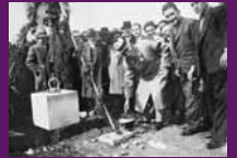
Sabadell, 5 març 1933 Francesc Macià acompanyat de Claudi Amelilla, governador civil de Barcelona, i de les autoritats locals, entre altres, durant l'acte de col·locació de la primera pedra d'un centre escolar.