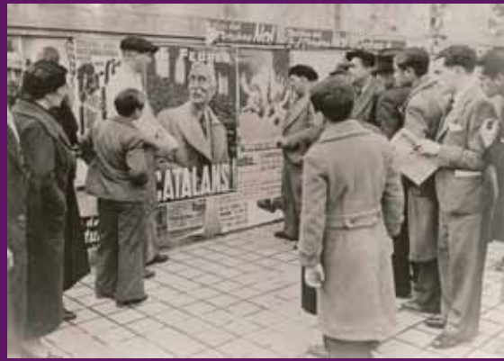
Barcelona, 15 febrer 1936 La memòria de Francesc Macià ha estat reivindicada permanentment des de la seva mort. La seva imatge fou un dels reclams més reeixits de l'exitosa campanya electoral del Front d'Esquerra.

Una estima que es fa palesa amb el nom venerable de «l'Avi» amb que el va batejar el poble. Perquè va veure en ell al «pare de la pàtria», a un home honest, íntegre i noble que no va dubtar mai a arriscar el seu nom, la seva carrera, el seu patrimoni i fins i tot la seva vida, per fer possible un horitzó col·lectiu de justícia social i llibertat nacional.