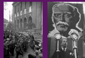
Barcelona, 27 desembre 1936 Entrada al míting celebrat per Esquerra al Palau de Belles Arts de Montjuïc commemorant els tres anys de la mort de Macià, en plena Guerra Civil.