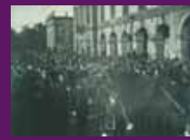
Barcelona, 27 desembre 1933 El fèretre del president Macià, sobre un armó d'antena escoltat per la guardia d'honor dels mossos d'esquadra al seu pas per davant del Parlament de Catalunya.