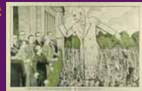
14 febrer 1936 Vinyeta de L'Esquella de la Torratxa on l'esperit de Macià recorda als catalans el deure de votar al Front d'Esquerra per aconseguir la llibertat amb premsa dels Fets del 9 d'Octubre.