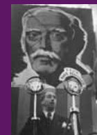
Barcelona, 27 desembre 1936 El president Companys, sota un retrat de Macià en el míting celebrat per Esquerra al Palau de Belles Arts de Montjuïc commemorant els tres anys de la mort de l'Expresident.