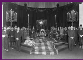
Barcelona, 26 desembre 1933 El fèretre del president Macià exposat al Saló de Sant Jordi del Palau de la Generalitat.