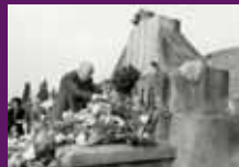
26 octubre 1977 El president Josep Tarradellas, acabat d'arribar de l'exili, realitzant una ofrena a la tomba de Francesc Macià.